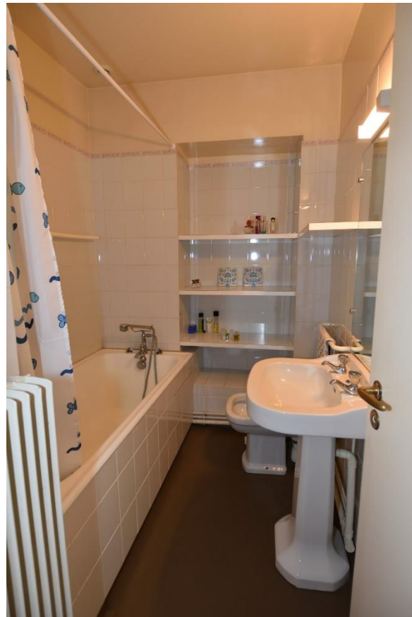
1 er ETAGE