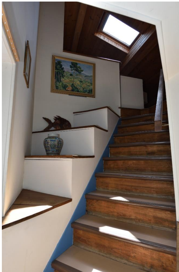
3 ème ETAGE