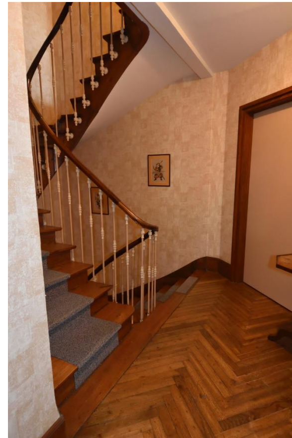
1 er ETAGE