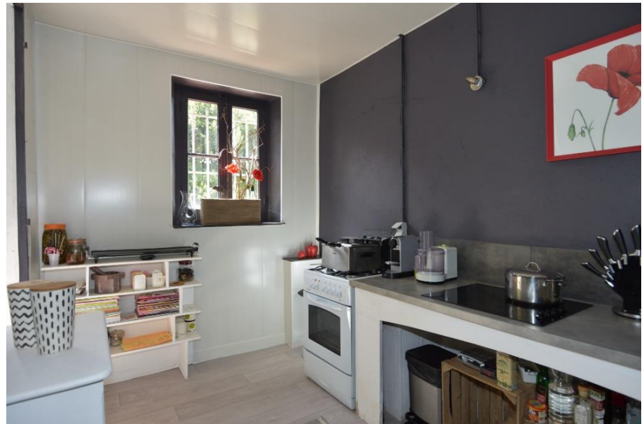
REZ-DE-JARDIN / RDC