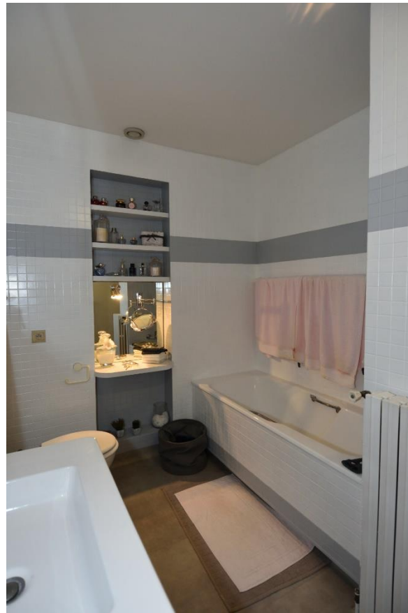
REZ-DE-JARDIN / RDC